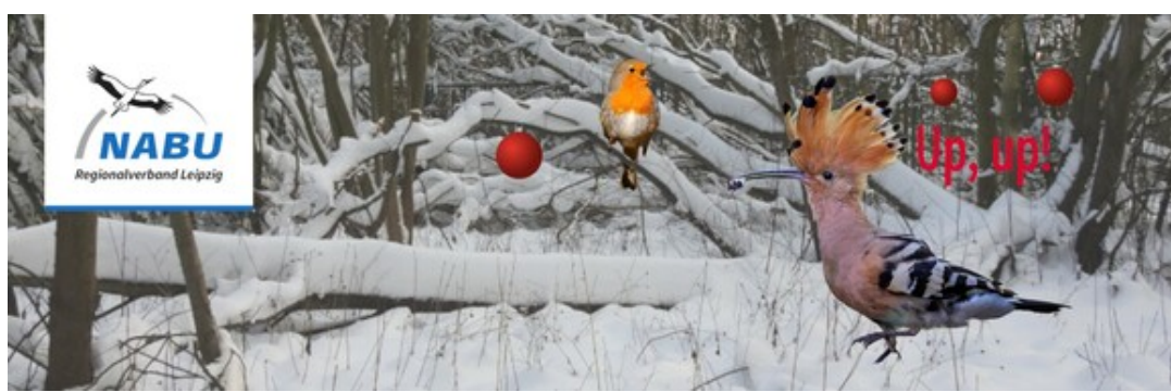
Rotkehlchen (Vogel des Jahres 2021), Wiedehopf (Vogel des Jahres 2022).